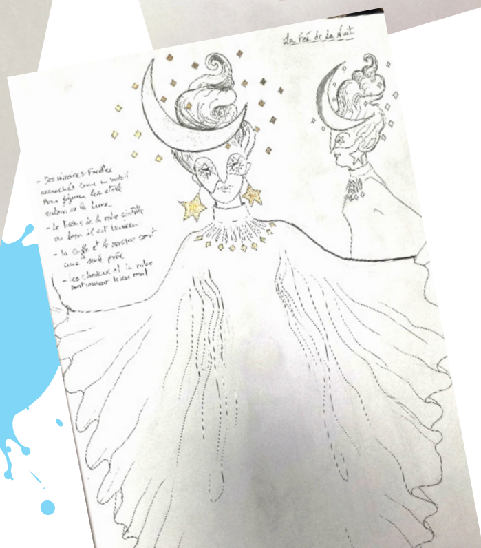
La reine de la Nuit et le gros bonheur (croquis de Einat Landais)